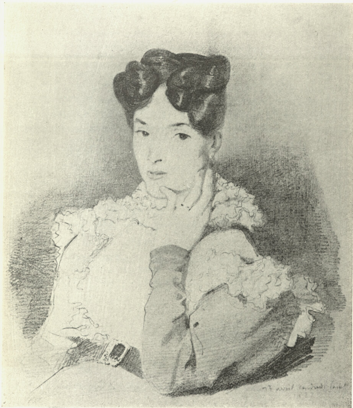
DELACROIX Portrait de Mme Pierret.