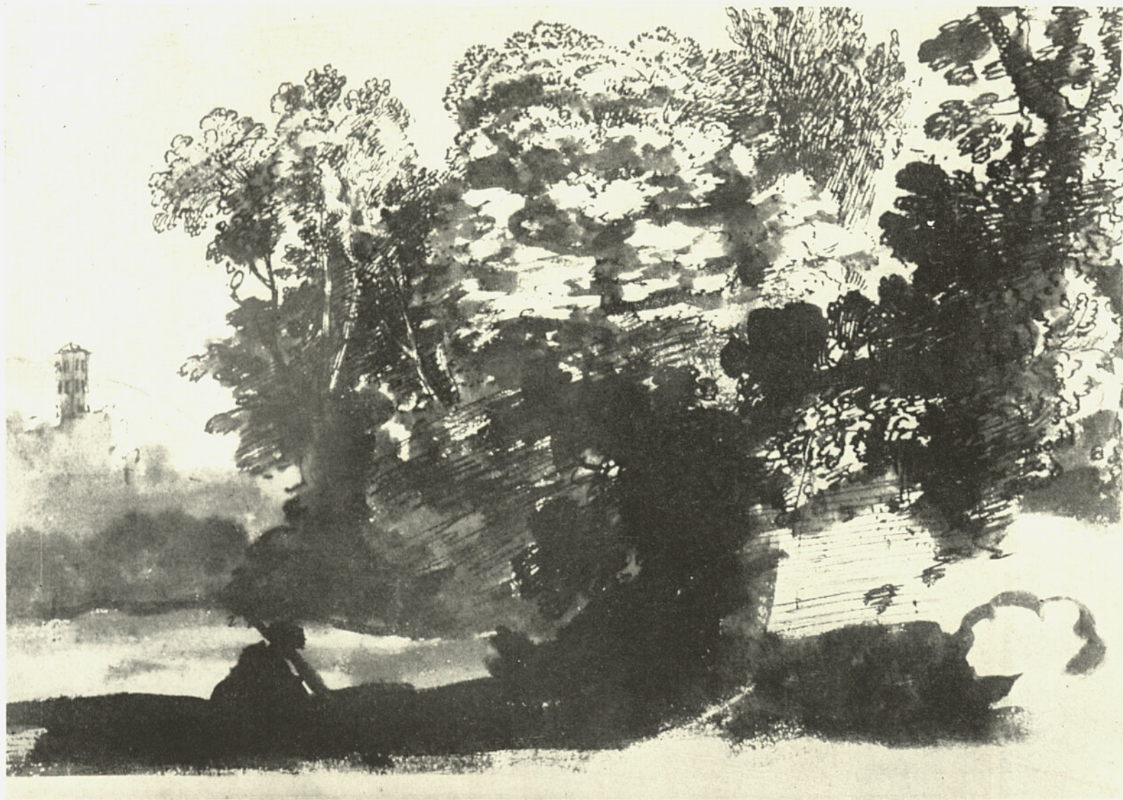
CL. GELLÉE Paysage.