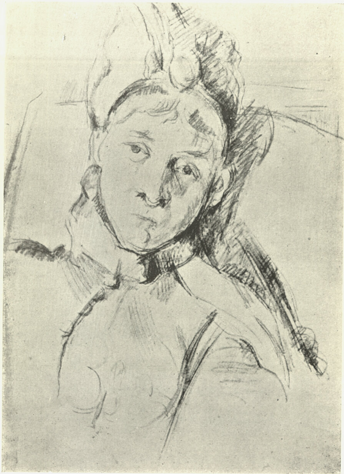
CEZANNE Portrait de Mme Cézanne.