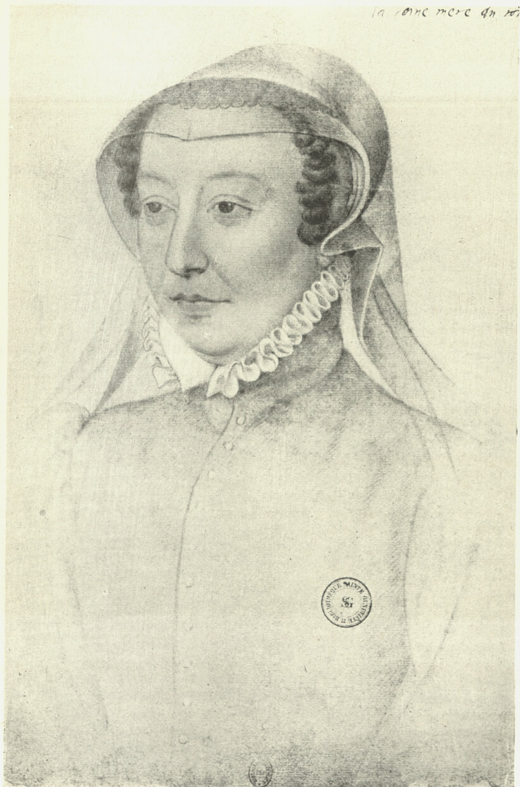
FRANÇOIS CLOUET Catherine de Médicis.