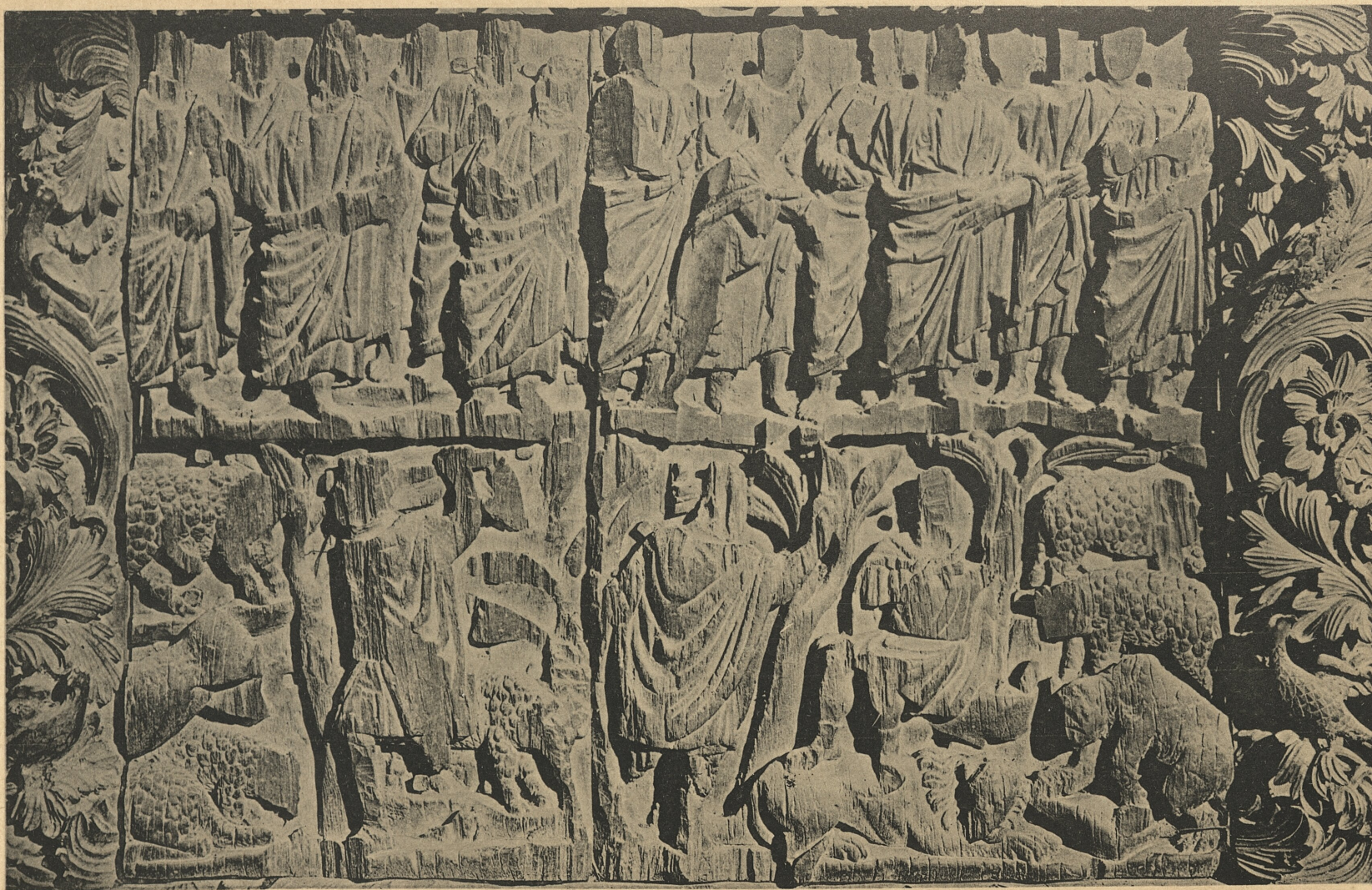
DAVIDS HIRTENLEBEN UND SALBUNG. THÜRFELDER IM ARCHIV VON S. AMBROGIO.