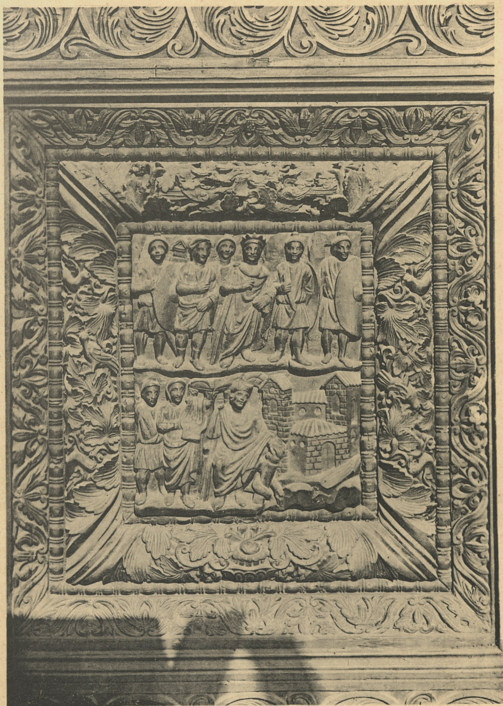
DAVID MELDET SICH BEI SAUL ZUM KAMPFE GEGEN GOLIATH. DAVID VERTREIBT DEN BÖSEN GEIST AUS SAUL.