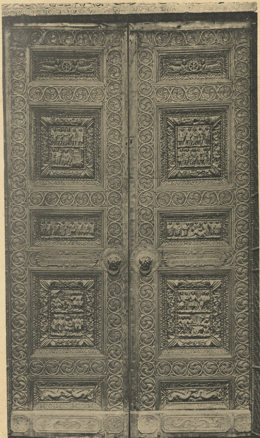
HOLZTHÜR VON S. AMBROGIO IN MAILAND.