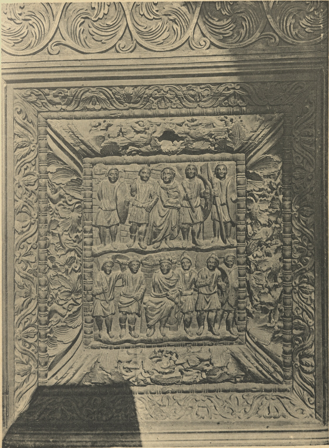
SAUL LEGT DAVID DIE RÜSTUNG ZUM KAMPFE AN. DAVID VERABSCHIEDET SICH ZUM KAMPFE.