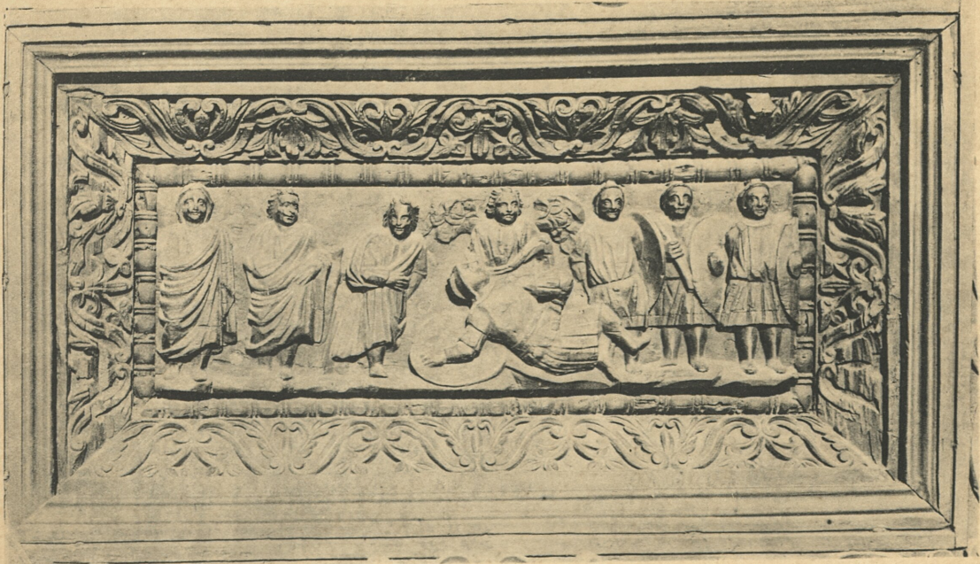
SIEG DAVIDS ÜBER GOLIATH.